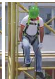
Salire sulle fasce con entrambe i piedi