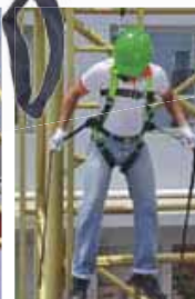
Collegare le estremità delle fasce