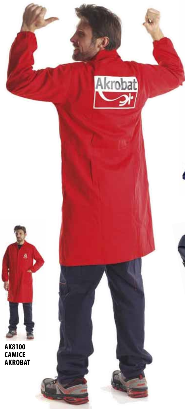
AK8100 CAMICE AKROBAT