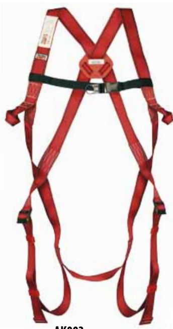
AK003 IMBRACATURA AKROBAT EN361 Punti di ancoraggio: dorsale e sternale Imballo: 20 pz.