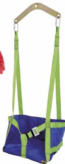
AKIS004 SEDUTA Comoda seduta da utilizzare agganciata all'attacco sternale dell'imbracatura.