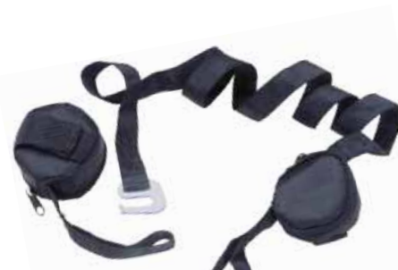
AKIS01 FASCE DI SOSPENSIONE Applicabili a tutti i tipi di imbracature. Appositamente studiate per alleviare gli effetti negativi di una temporanea sospensione a seguito di una caduta. In caso di necessità, estrarre le due fasce, legarle tra loro e appoggiare i piedi sulla fune di sospensione ottenuta, in attesa dei soccorsi (vedi foto). Confezione: 1 paio