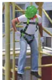
Estrarre e srotolare le fasce