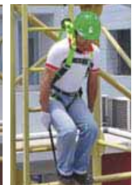
Attendere i soccorsi