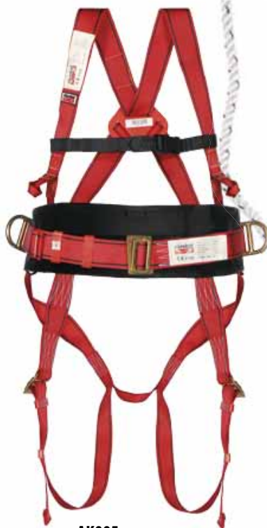
AK005 IMBRACATURA AKROBAT EN361 - EN358 Punti di ancoraggio: dorsale e sternale più cintura di posizionamento Imballo: 10 pz.