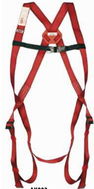
AK002 IMBRACATURA AKROBAT EN361 Punti di ancoraggio: dorsale Imballo: 20 pz.

economica: deve essere intesa come una linea "essenziale" adatta perciò all'utilizzatore che ne fa un uso sporadico o a colui che rinuncia volentieri ad un livello di comfort superiore (ma non di sicurezza) a fronte di un risparmio economico.