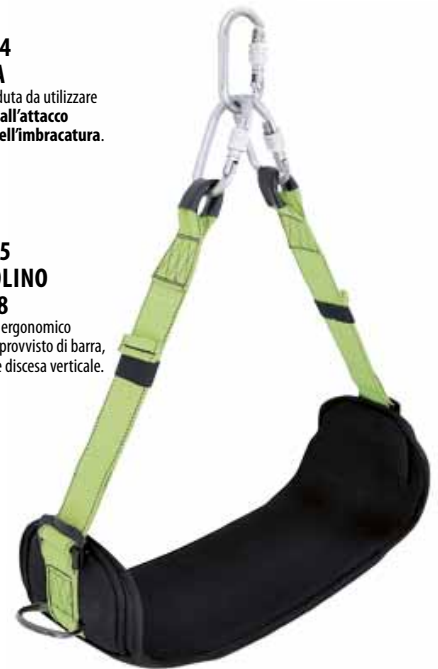
AKIS005 SEGGIOLINO EN 1498 Comodo ed ergonomico seggolino, provvisto di barra, per ascesa e discesa verticale.